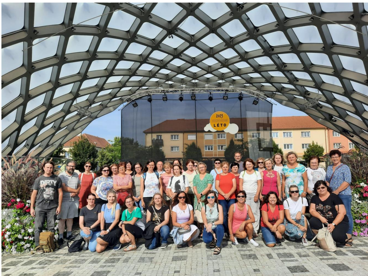
Foceno ve Veselí na Moravou

Dne 13. 11. 2023 byla poslední porada toho roku pro neprofesionální knihovníky a 4. 12. 2023 proběhla porada pro profesionální knihovníky v Místní knihovně ve Vranově nad Dyjí.