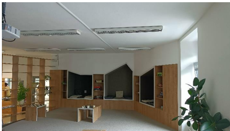
Městská knihovna Kyjov