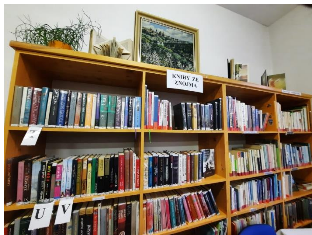
Obecní knihovna Šatov