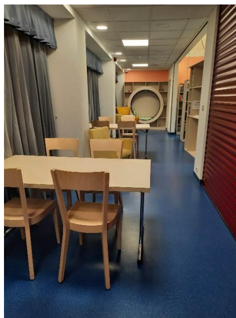
Městská knihovna Veselí nad Moravou