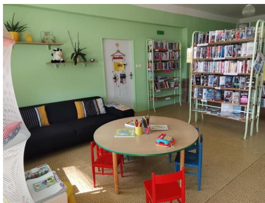
Obecní knihovna Břežany