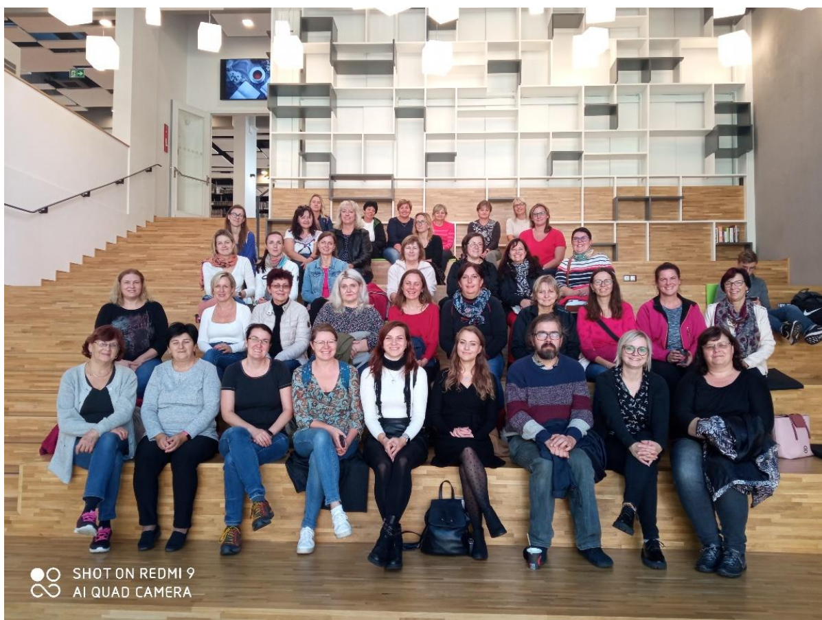
Krajská knihovna Vysočiny

Výjezdni porady považujeme za velmi důležité, zejména z důvodu ukázek dobré praxe, výměny zkušeností a rozvoje povědomí o lokálních tradicích i historii, což lze dále využít při práci knihoven.