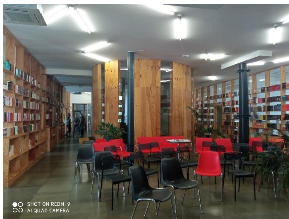
Nakladatelství Host Brno