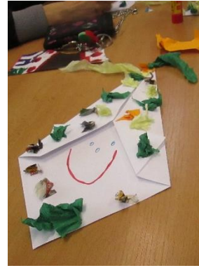
Strakatý - postava symbolizovala šťastný, veselý a pestrý rok